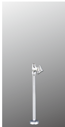
ストレート形止水栓 K31-37P2 [2][30] ¥7,300 (税込¥8,030)