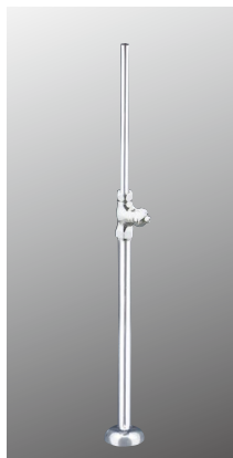
ストレート形止水栓 K31A37 [2][30] ¥7,800 (税込¥8,580)