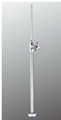
ストレート形止水栓 K31 [2][30] ¥7,900 (税込¥8,690)