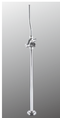
ストレート形止水栓 K30YWAZKN [2][20] ¥12,500 (税込¥13,750)