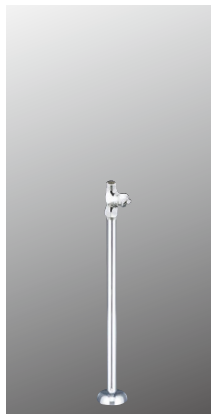
ストレート形止水栓 K31AP2 [2][30] ¥7,400 (税込¥8,140)