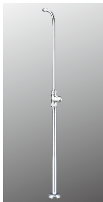
ストレート形止水栓 K31ANB [2][30] ¥8,500 (税込¥9,350)