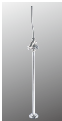
ストレート形止水栓 K30YAKN [2][20] ¥11,000 (税込¥12,100)