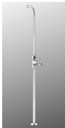
ストレート形止水栓 K31NB [2][30] ¥8,600 (税込¥9,460)