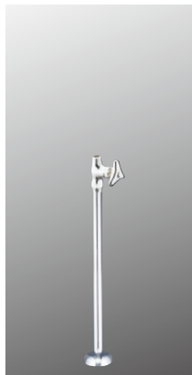
ストレート形止水栓 K31-P2 [2][30] ¥7,400 (税込¥8,140)