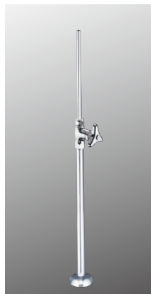
ストレート形止水栓 K31-37 [2][30] ¥7,800 (税込¥8,580)