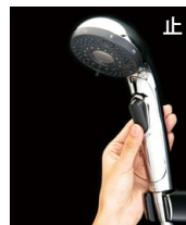
正面手元ボタンでカンタン出し止め