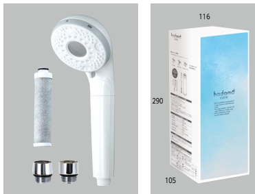
ウルトラファインバブル浄水シャワーヘッド(パールホワイト)