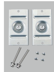
専用特殊座金セット

ユニットバスに取り付ける場合、 ねじのねじ込み部及び壁の補強 を十分に行い、別売の専用特殊 座金セット Z422444 をご使 用ください。