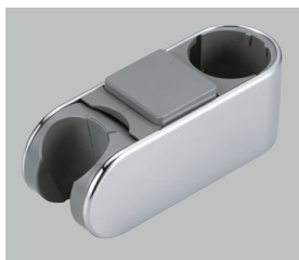
スライドハンガー単体