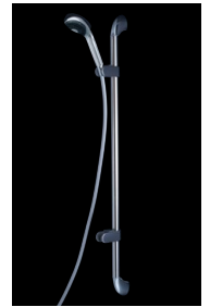
立ってシャワーを浴びるポジション