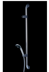
座って使用するポジション