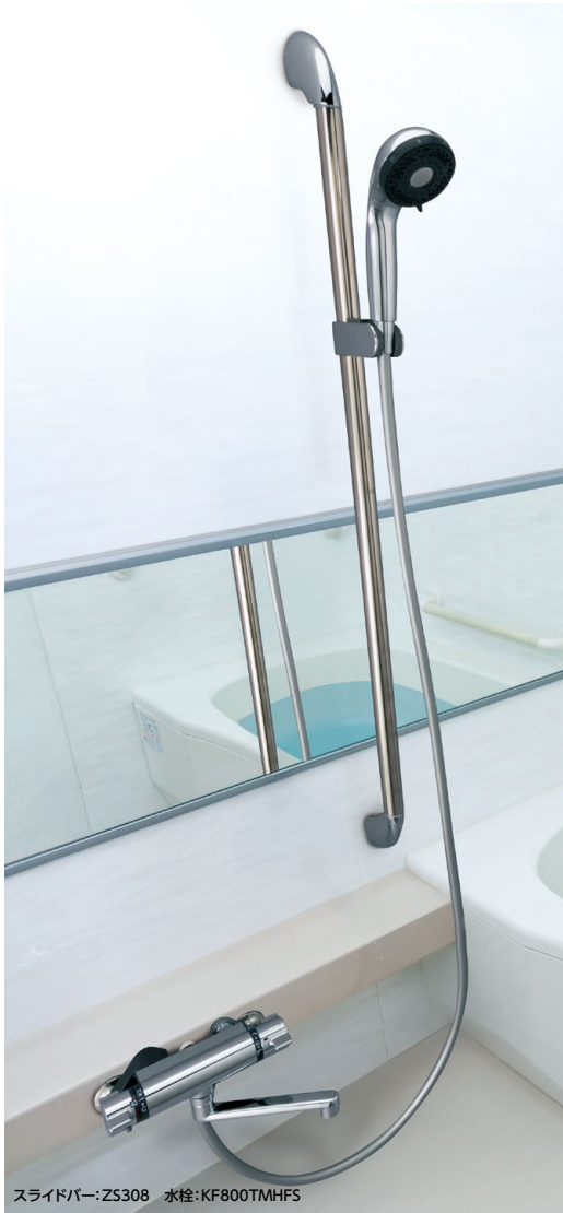
スライドバー:ZS308 水栓:KF800TMHFS