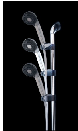
〈使用例〉シャワーヘッドはPZS370Tです。 ※シャワーヘッド・シャワーホースは付属していません。