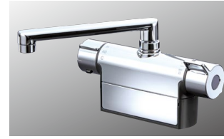
サーモスタット式混合栓