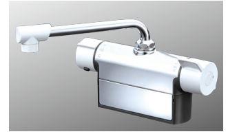
サーモスタット式混合栓