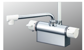
デッキ形サーモスタット式シャワー