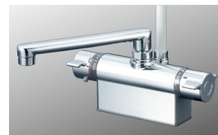
デッキ形サーモスタット式シャワー