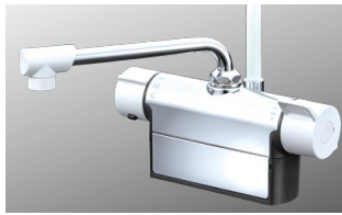
デッキ形サーモスタット式シャワー